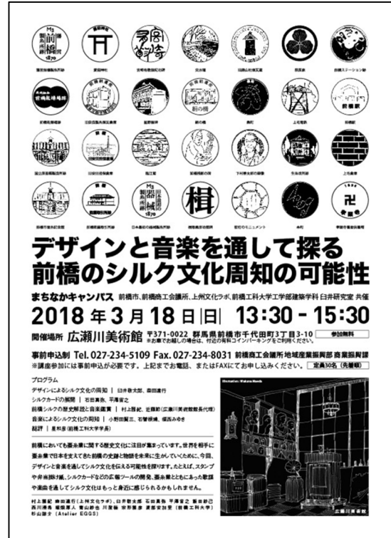
図 6. まちなかキャンパスリーフレット