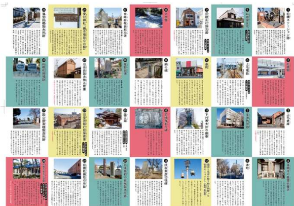
図2. 前橋絹遺産MAP（B4，裏面）