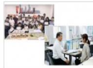
特15. 前橋工科大学 未来へつなごうプロジェクト

多くの工学人材を輩出してきた前橋工科大学が、学生支援や国際交流などの充実により、さらに全国に誇れる大学へ躍進するための取り組みに活用します。